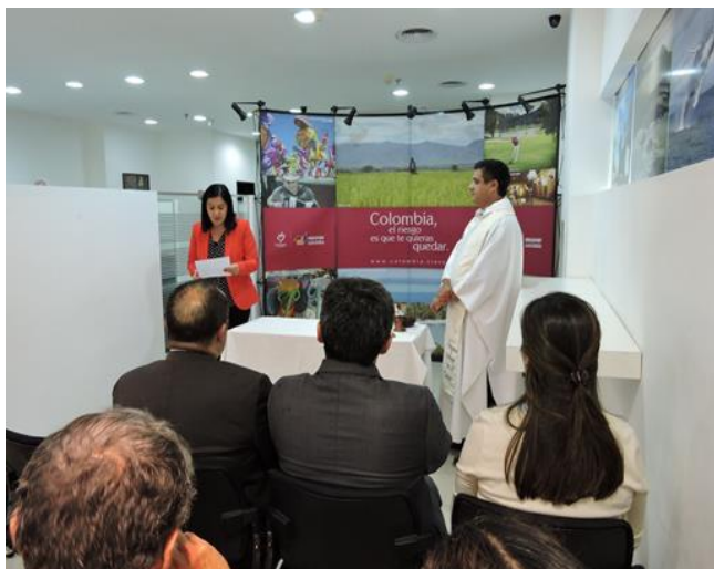
Intervención de la Cónsul General (E), Olga Lucía Reyes Escobar

El Consulado General de Colombia en Buenos Aires realizó el pasado 4 de abril una ceremonia en conmemoración del Día de la Memoria y Solidaridad con las Víctimas del Conflicto Armado en Colombia.